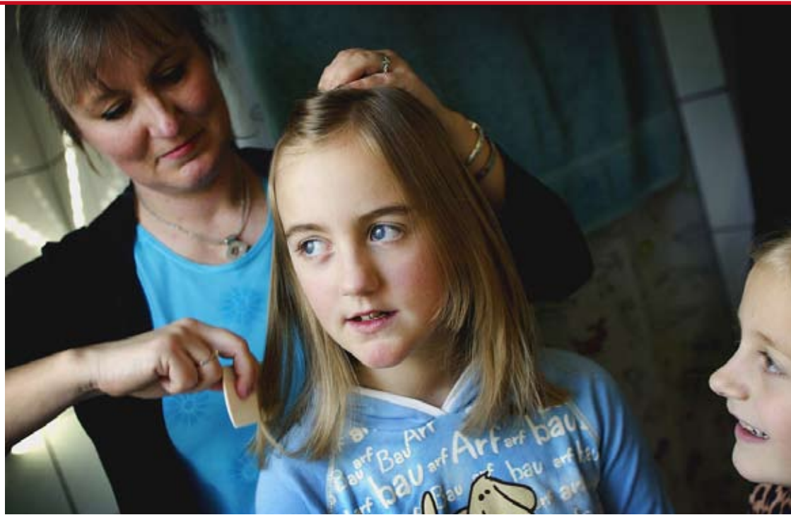
Når børn er tæt sammen i skoler og daginstitutioner, kravler lusene fra hovedet til hovedet.