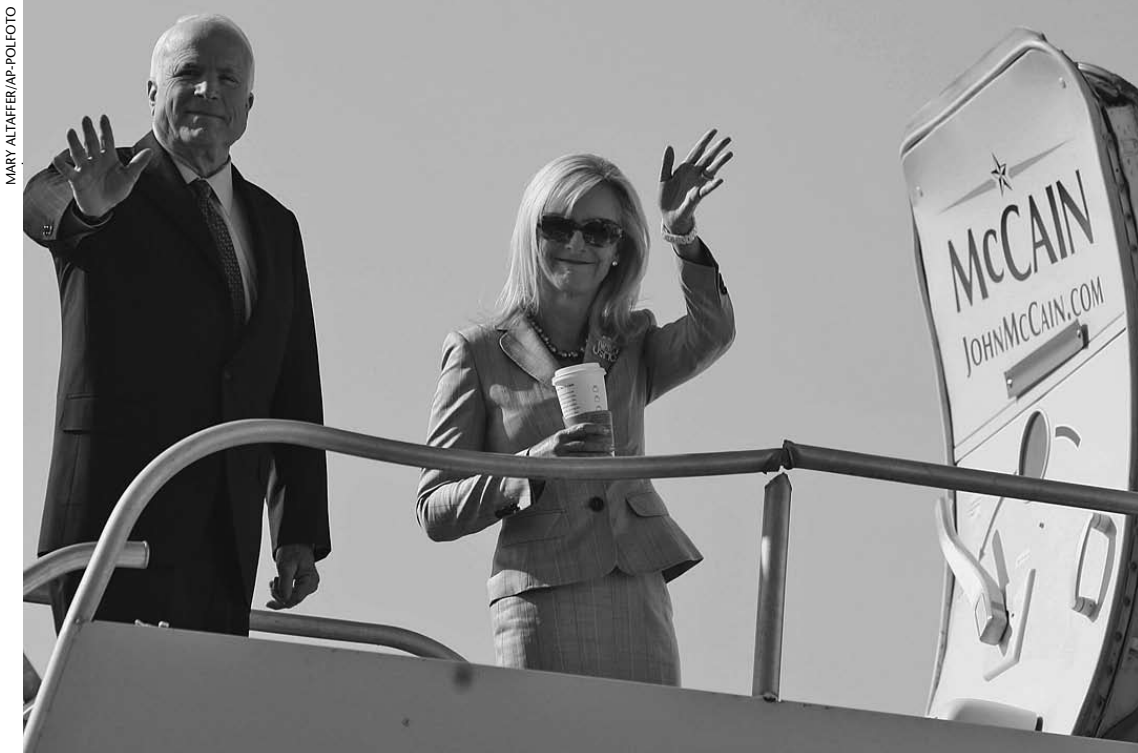
John McCains velhavende hustru Cindy har skudt millioner af dollars i sin mands valgkamp.