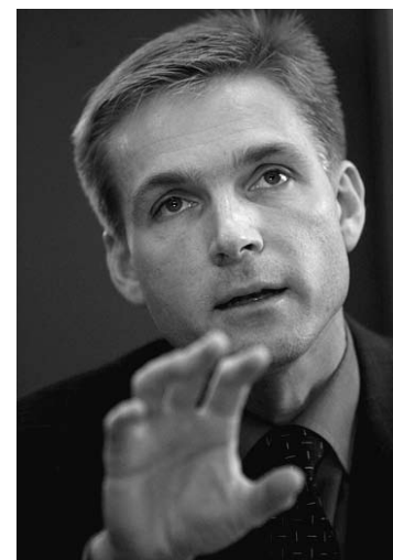
Kristian Thulesen Dahl vil ikke have tvungen opsparing.