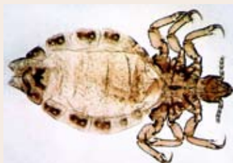
Sådan ser en lus ud, når man forstørret den.

En hun-lus kan lægge 8 æg om dagen. Det kan hurtigt blive til mange lus! Æggene er hvide. De er lidt mindre end 1 millimeter lange. De