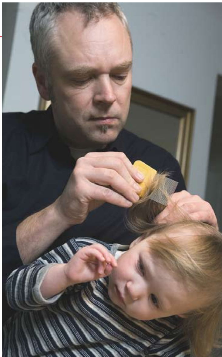
Målet er, at alle skoler og daginstitutioner skal holde Store Lusedag to gange om året. Så kan alle børn blive tjekket for lus.

Læs mere om Store Lusedag på www.hovedlus.dk .