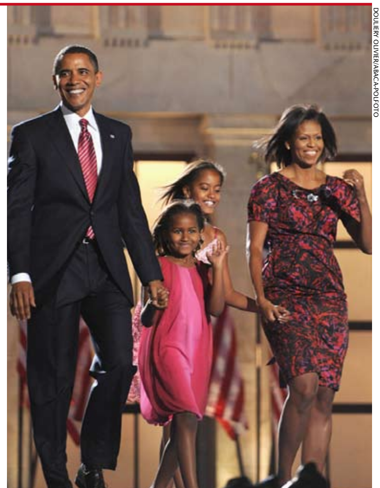
Barack Obama og hans familie blev hyldet på partiets konvent.