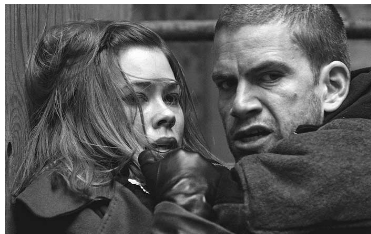
Birgitte Hjort Sørensen og Nikolaj Lie Kaas i "Kandidaten".

Kandidaten handler om den unge advokat Jonas